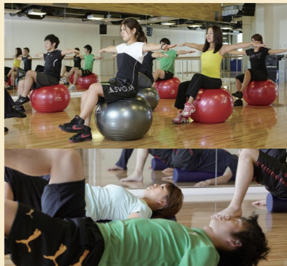
アトリオドゥー工 出張レッスン

健康相談会では専用の機器を使って様々な 角度から皆さまのカラダの状態を測定します。 (所要時間:それぞれ5分)